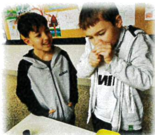
R I E C H E N