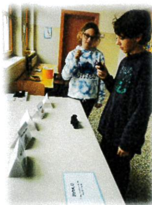
H Ö R E N