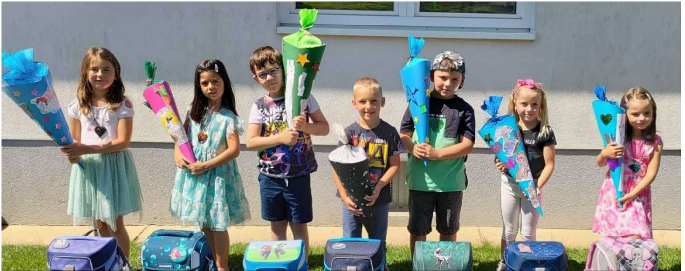
Kindergarten – Jahrgang 2016

AMTLICHE MITTEILUNG DER GEMEINDE UNTERRABNITZ-SCHWENDGRABEN Ausgabe 02 – Juni 2023